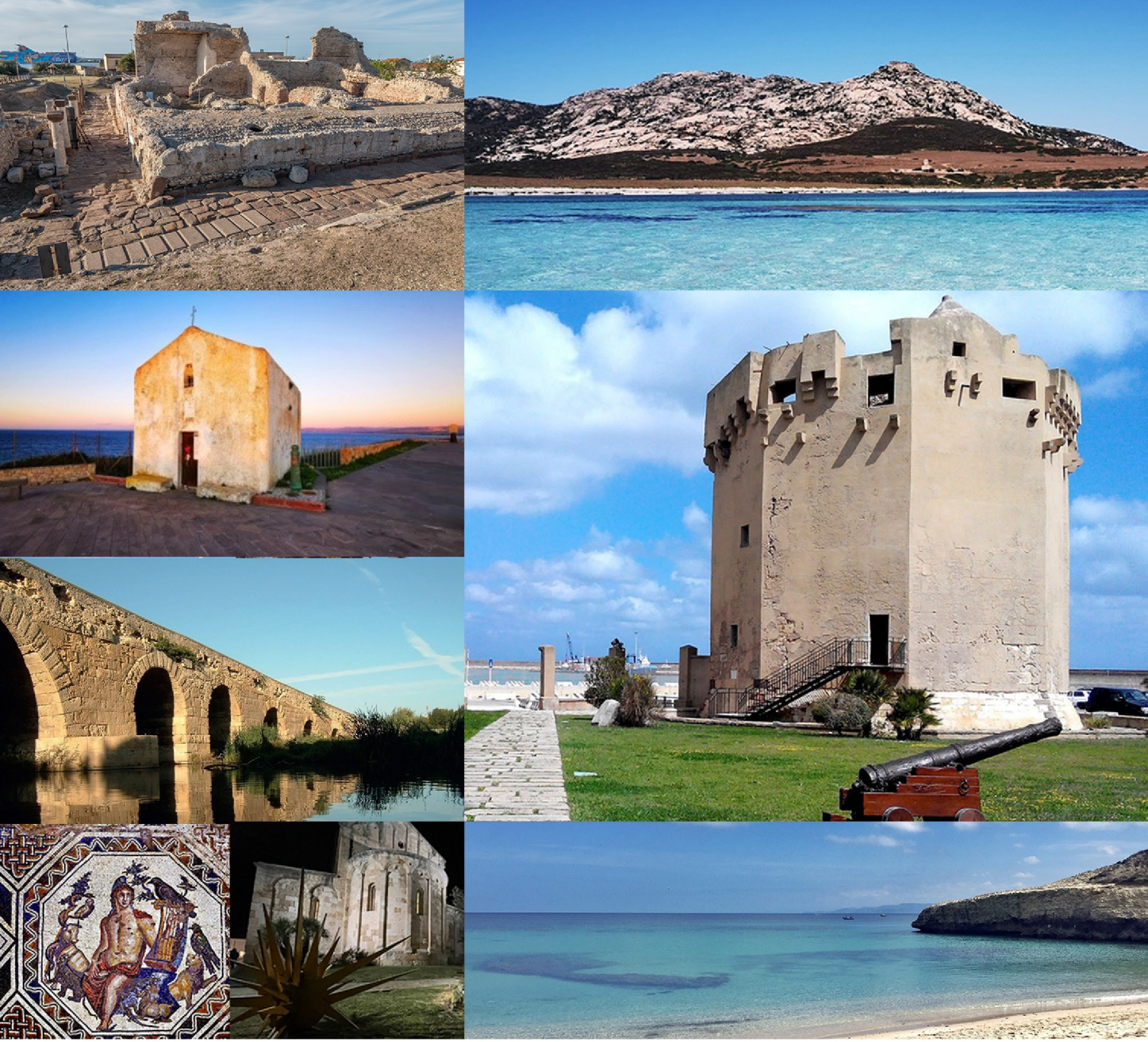
S.C.A.01a Carta dei Beni paesaggistici storico culturali Scala 1:10.000